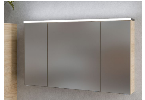
Leuchte mit move Funktion