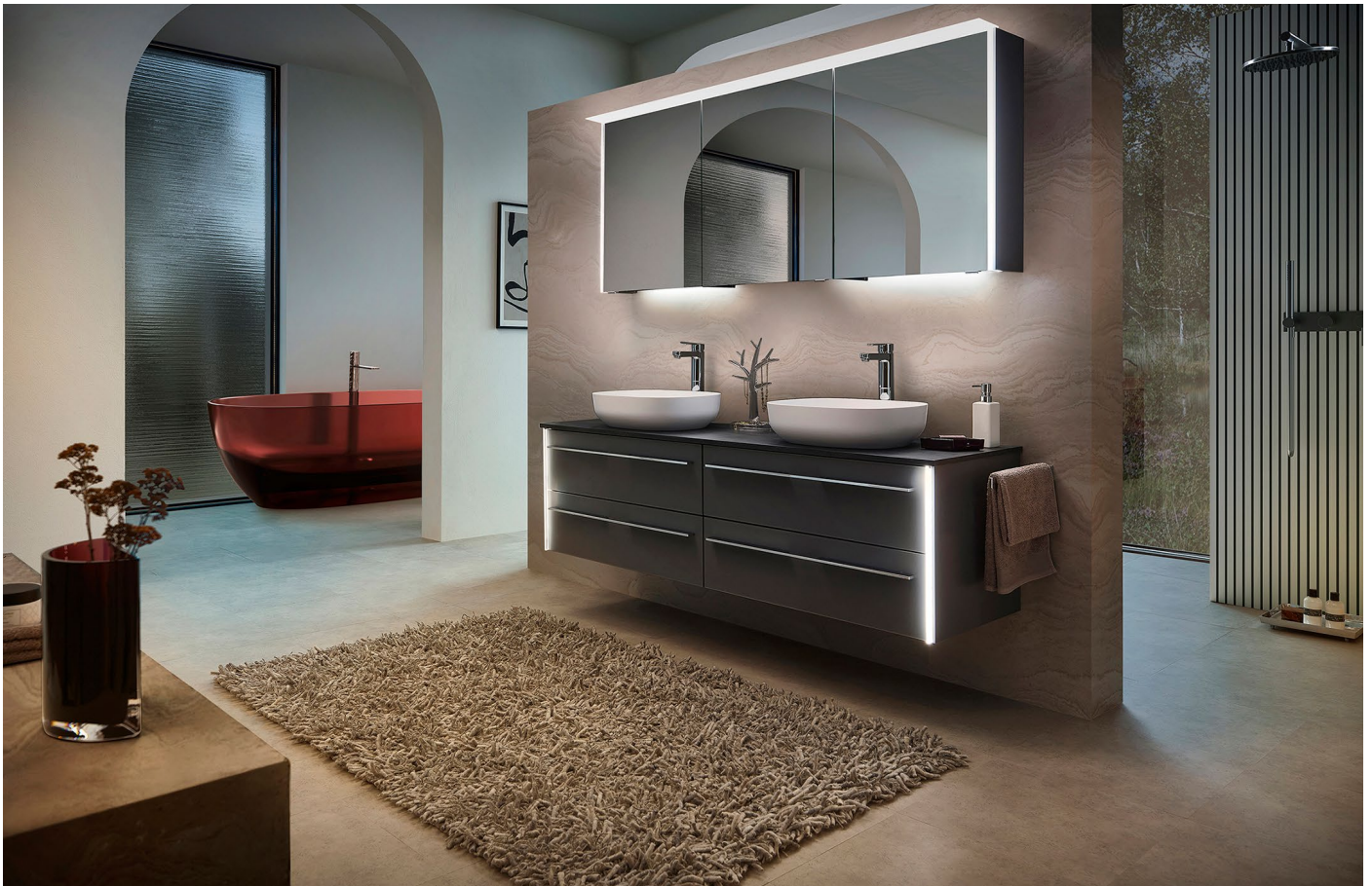
Serie Leo 116

Mit Innovationen von Pelipal durch die dunkle Jahreszeit