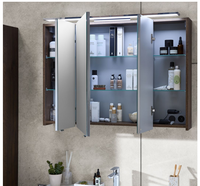
Marlin Serie Concept 10